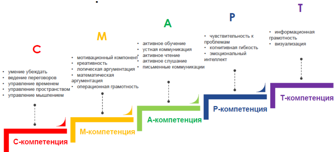
Рис. 6 Модель SMART-навыков школьника

На рисунке 6 представлена модель SMART-навыков школьника.