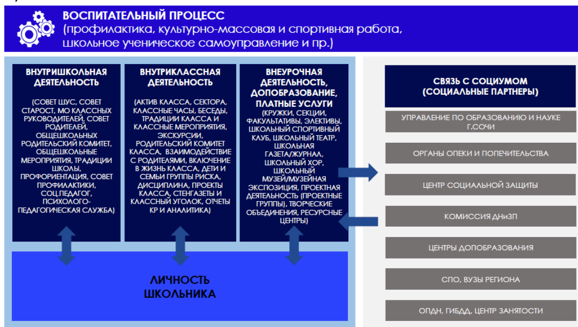
Рис. 2 Воспитательный процесс как структурный элемент SMART-пространства ОО.

Как видно из рисунка, одним из центральных элементов модели формируемого SMART-пространства общеобразовательной школы является воспитательный процесс, который включает в себя ряд направлений, представленных на рисунке 2.