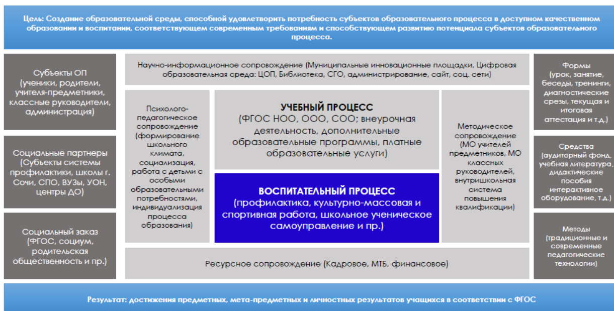
Рисунок 1 Модель SMART-пространства общеобразовательной школы

За основу модели взята модель педагогической системы, которая дополнена в соответствии с современными требованиями. Данная модель может быть применена в любой общеобразовательной школе с небольшими корректировками, отражающими специфику того или иного учебного заведения.